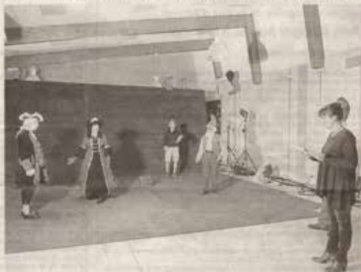
Les comédiens répètent leur texte avant le tournage, tandis que les machinistes et metteurs en scène règlent les derniers détails.

Une fiction ngolotte et très attractive, dont l'objectif premier est la découverte d'un potager. Le tournage s'effectue sur le principe de la météo, sur un grand tapis vert, et à l'écran apparaît un vrai jardin. Après la séance maquillage et habillage, les comédiens répètent leur texte, tandis que les metteurs en scène prennent